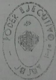
C.RN. GERARDO RUBEN MORALES GOBERNADOR

EFICO QUE LA PRESENTE COPIA COPIA ES AUTENTICA DEL ORIGINAL RETENIDO A LA VISTA.